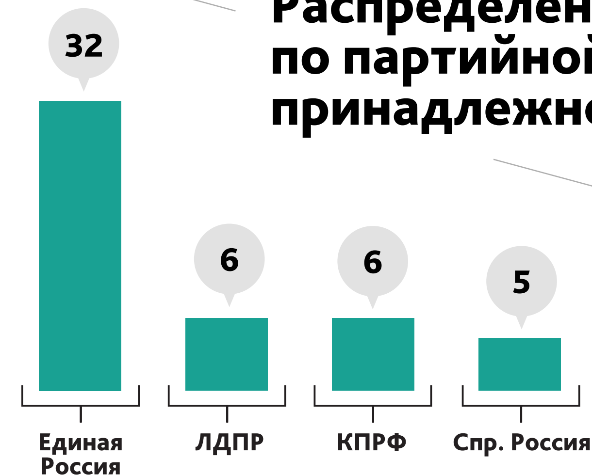
Распределение по партийной принадлежности